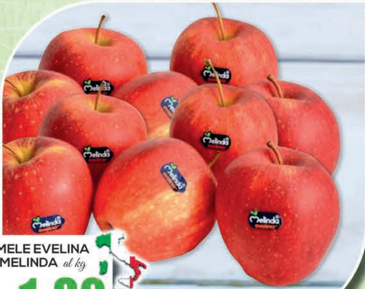
MELE EVELINA MELINDA al kg