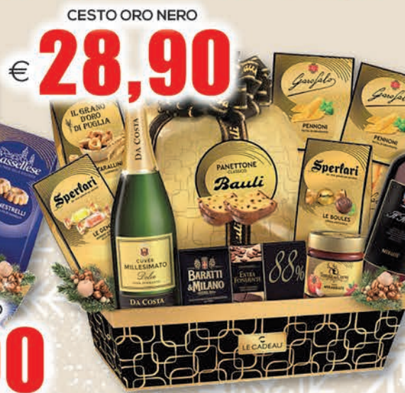
CESTO ORO NERO