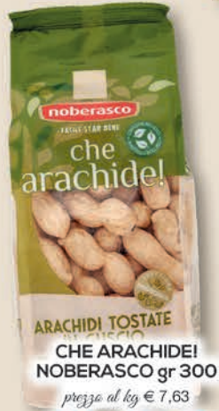
CHE ARACHIDE! NOBERASCO gr 300