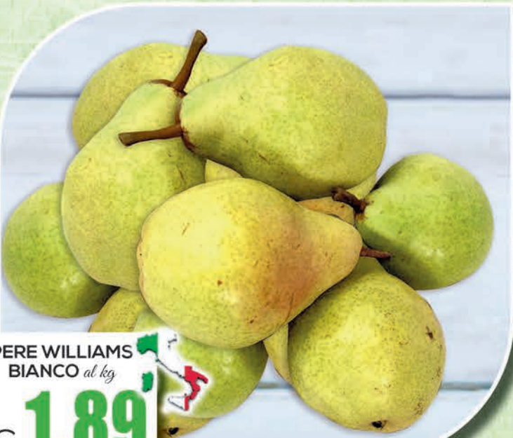
PERE WILLIAMS BIANCO al kg