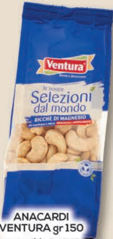
ANACARDI VENTURA gr 150