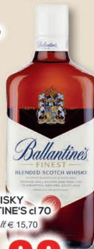
WHISKY BALLANTINE'S cl 70