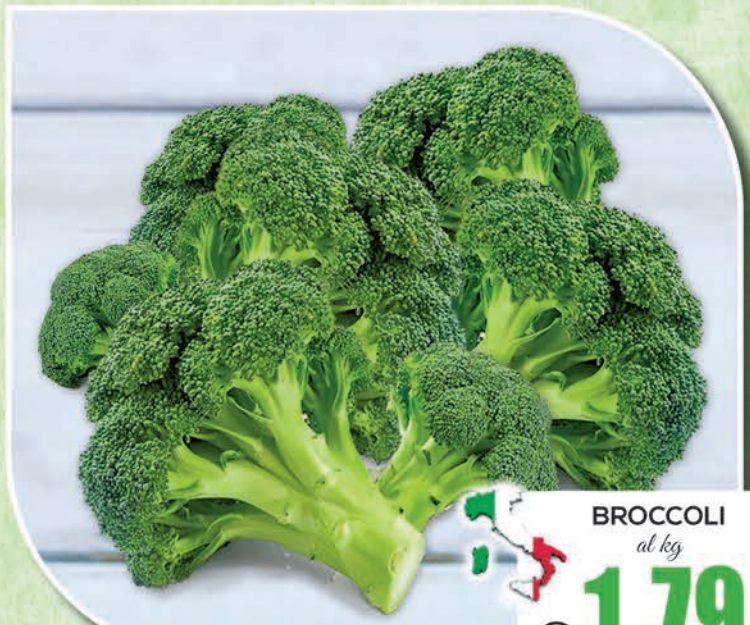
BROCCOLI al kg