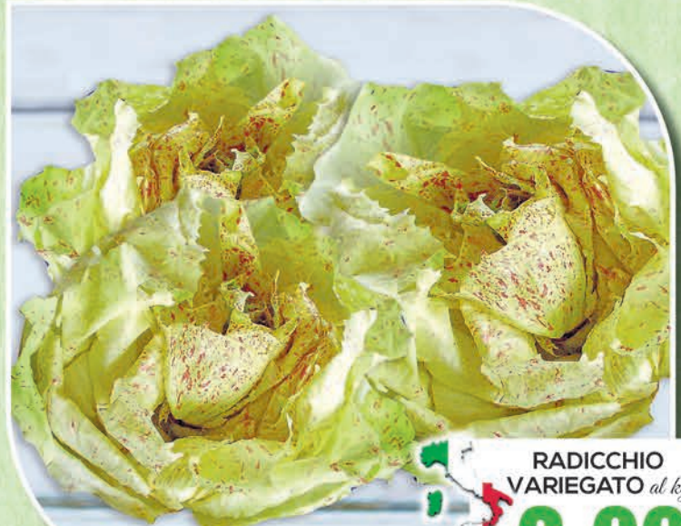
RADICCHIO VARIEGATO al kg