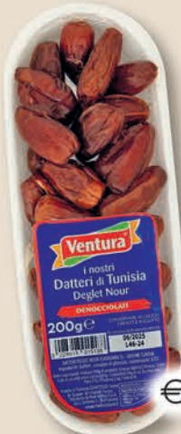
DATTERI DENOCCIOLATI gr 200