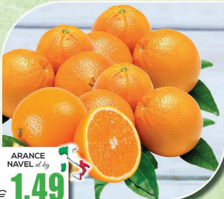
ARANCE NAVEL al kg