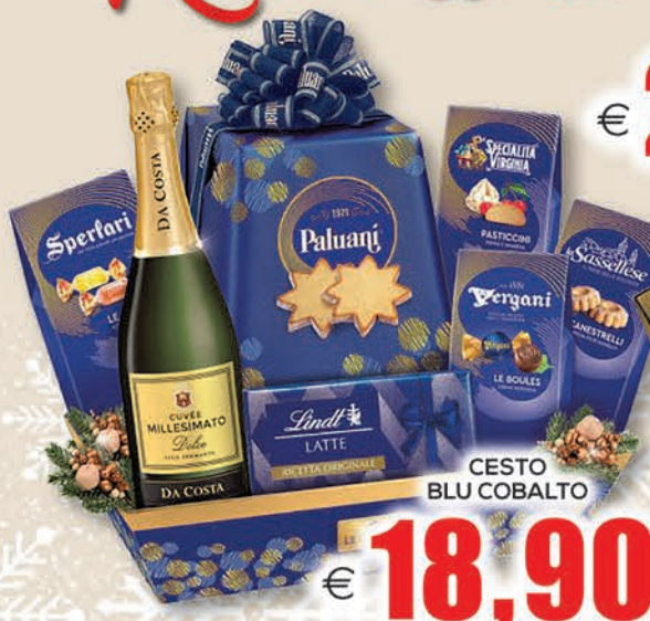
CESTO BLU COBALTO