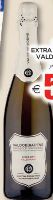
PROSECCO EXTRA DRY MILLESIMATO VALDOBBIADENE cl 75