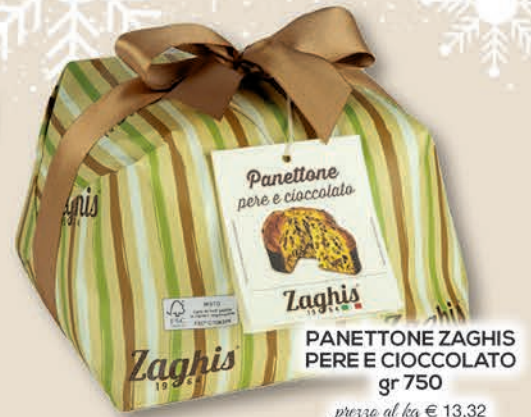
PANETTONE ZAGHIS PERE E CIOCCOLATO gr 750