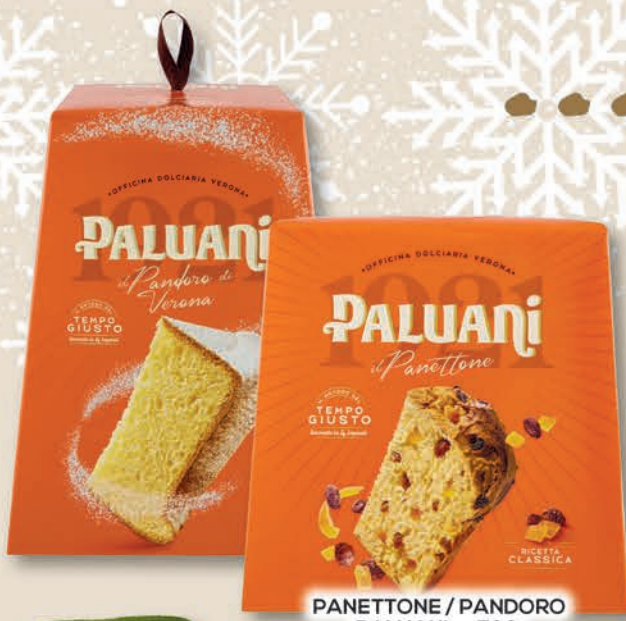
PANETTONE / PANDORO PALUANI gr 700