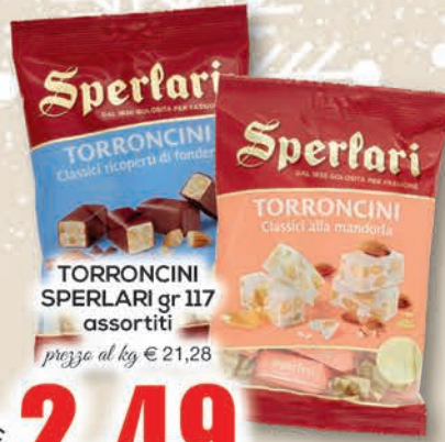
TORRONCINI SPERLARI gr 117 assortiti