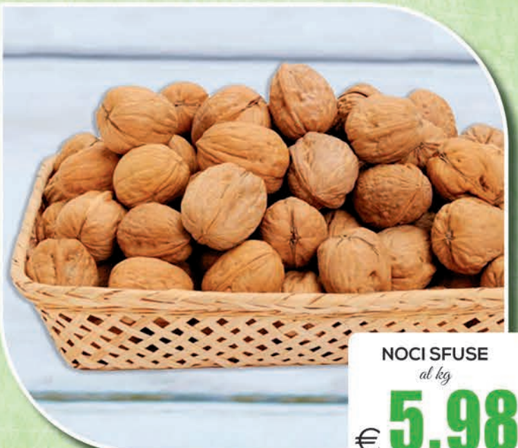
NOCI SFUSE al kg